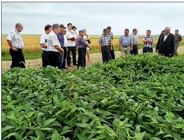
Поле сои по No-till с «августовской» защитой привлекло всех