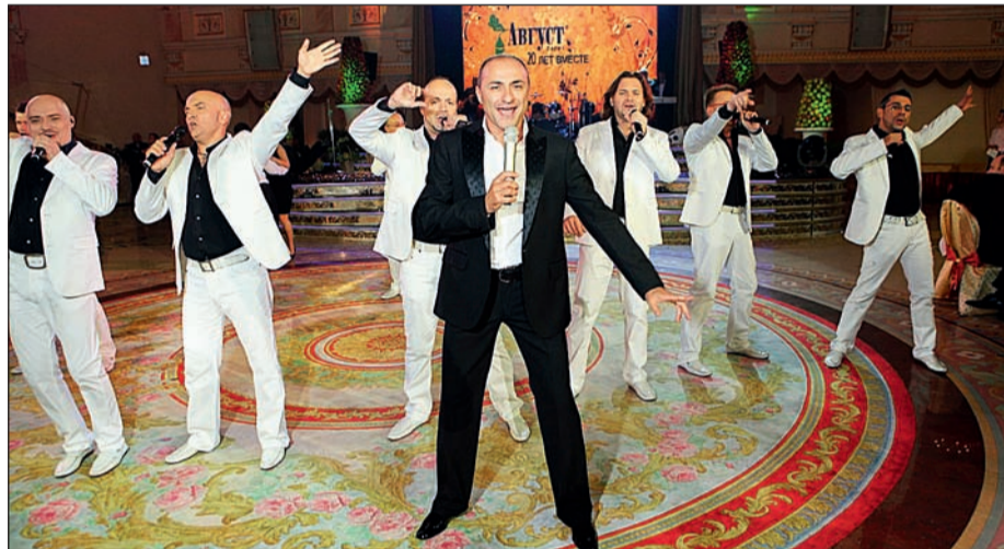
Хор Турецкого: «Августу» – браво!»

Празднование юбилея компании продолжилось 3-5 сентября корпоративной встречей в подмосковном пансионате «Бор». Здесь собралось около 700 «августовцев» из региональных представительств фирмы в России, филиала «ВЗСП», а также зарубежных