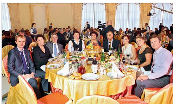
За одним из праздничных столов