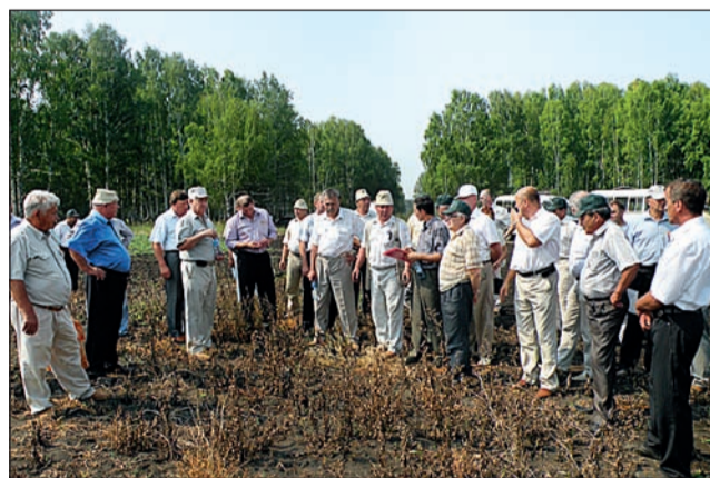
Дискуссия на паровом поле: торнадо 500 сработал отлично!

А началась работа семинара с утреннего объезда полей, на которых земледельцы могли в реальных условиях, на посевах зерновых и паровых полях, сравнить эффективность представленных препаратов различных компаний. Среди протравителей семян зерновых достойно выглядел виал ТрасТ, который даже в экстремальных условиях