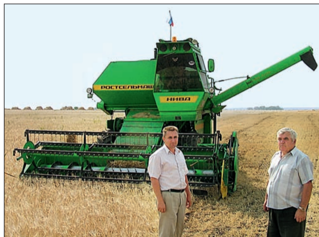
В хозяйстве идет уборка зерна

Самое главное наше богатство – люди. В колхозе имени Калинина работают 280 человек, включая растениеводов, животноводов и административный персонал. Зарплата для сельского хозяйства неплохая – в сезон механизатор может заработать 60 - 65 тыс.