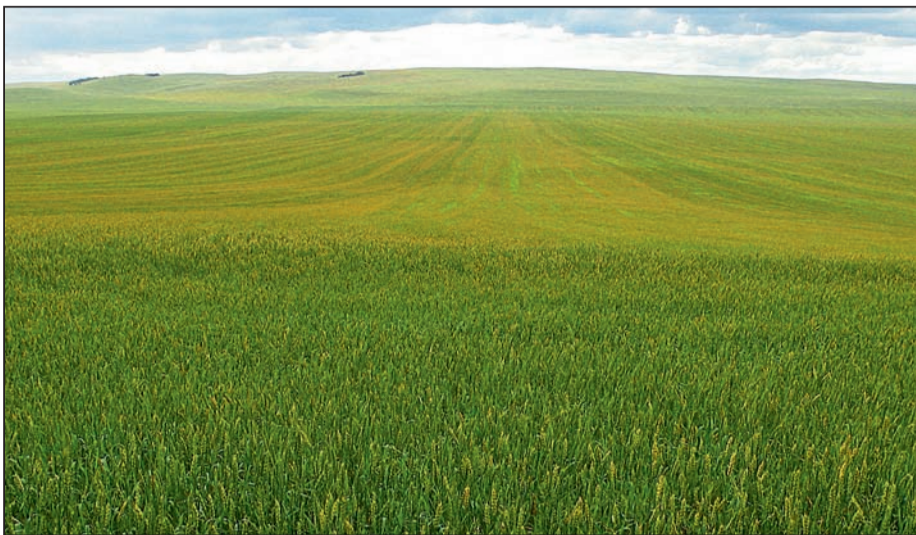
Современные технологии в действии на бескрайних полях Хакасии

но недавно появился на рынке. Добавляем его во все обработки, где это допустимо. И эффект очевиден. Адыю в смеси с гербицидом сплошного действия торнадо 500 заметно повышает эффективность его действия и позволяет нам значительно экономить средства на обработке чистых паров и земель, вводимых в активный сельскохозяйственный оборот. Раньше мы применяли торнадо 500 в норме расхода 3 л/га, теперь – 2,5 л/га, а эффект такой же. Те 6 тыс. га, которые мы присоединили к хозяйству, в этом году также обработали торнадо 500 с адыю. Еще один плюс адыюванта – он снимает с меня и других наших работников психологическое напряжение, ведь эффект действия гербицида проявляется гораздо раньше. Недавно провели эксперимент. Обычно мы залежь стараемся сразу «пропустить» через чистый пар. А на одном поле решили подождать, пока не взойдет максимум видов сорняков. В результате большинство растений переросло, миновало стадию всходов, травостой был уже высокий, а видовое разнообразие – хоть ботанический атлас составляй. И тогда мы провели обработку торнадо 500 с адыю. Гербицид сработал идеально. В положенный срок все поле пожелтело, погибли все сорняки, включая пырей. Это нас очень порадовало, ведь часто приходится делать несколько обработок, так как на семена торнадо 500 не действует, и появляются новые «волны» всходов сорняков.