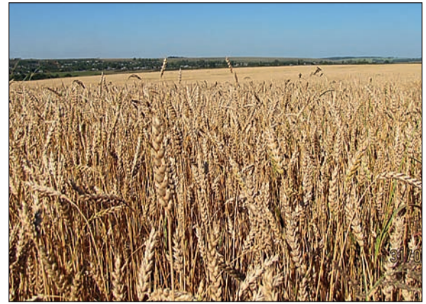
Алтайское поле пшеницы накануне уборки