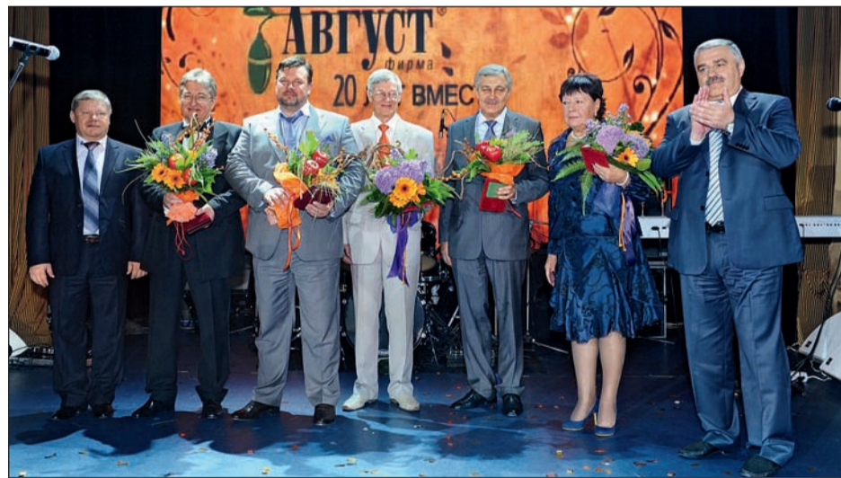
С наградами Минсельхоза РФ

На праздник приехали два государственных чиновника, с которыми «августовцы» встречаются довольно часто, в основном на Днях поля