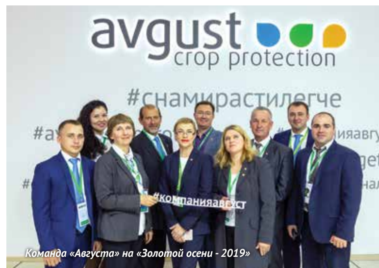
Команда «Августа» на «Золотой осени - 2019»

Ольга РУБИЦ