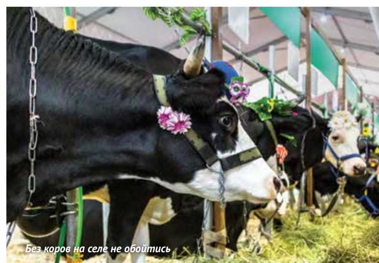
Без коров на селе не обойтись