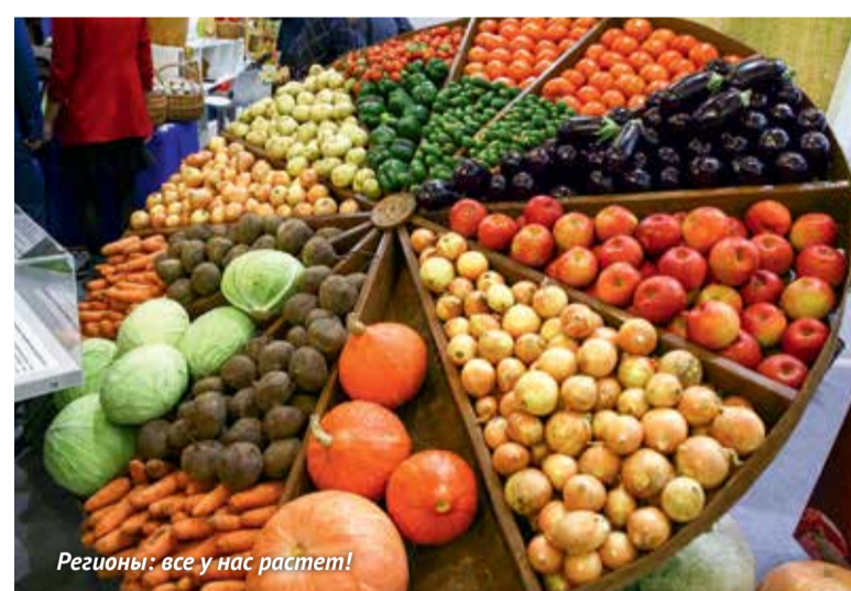
Регионы: все у нас растет!