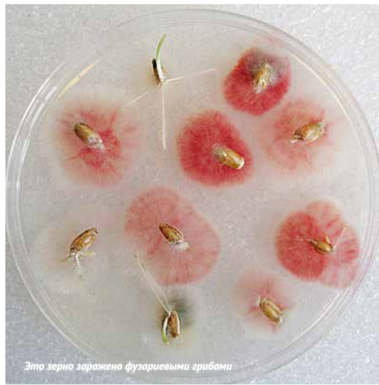
Это зерно заражено фузариевыми грибами

Фунгицидные обработки во время вегетации необходимы в большинстве случаев. Причем всегда следует иметь в виду, что симптомы поражения колоса фузариевыми грибами могут быть неочевидными. Если погодные условия складываются благоприятно для развития