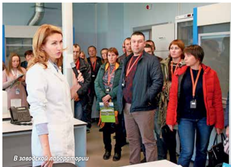
В заводской лаборатории

Одними из первых посетителей нового завода компании «Август» по производству ХСЗР «Август-Алабуга» в Республике Татарстан стали специалисты из хозяйств Удмуртии и Пермского края. Эта поездка состоялась 8 октября.