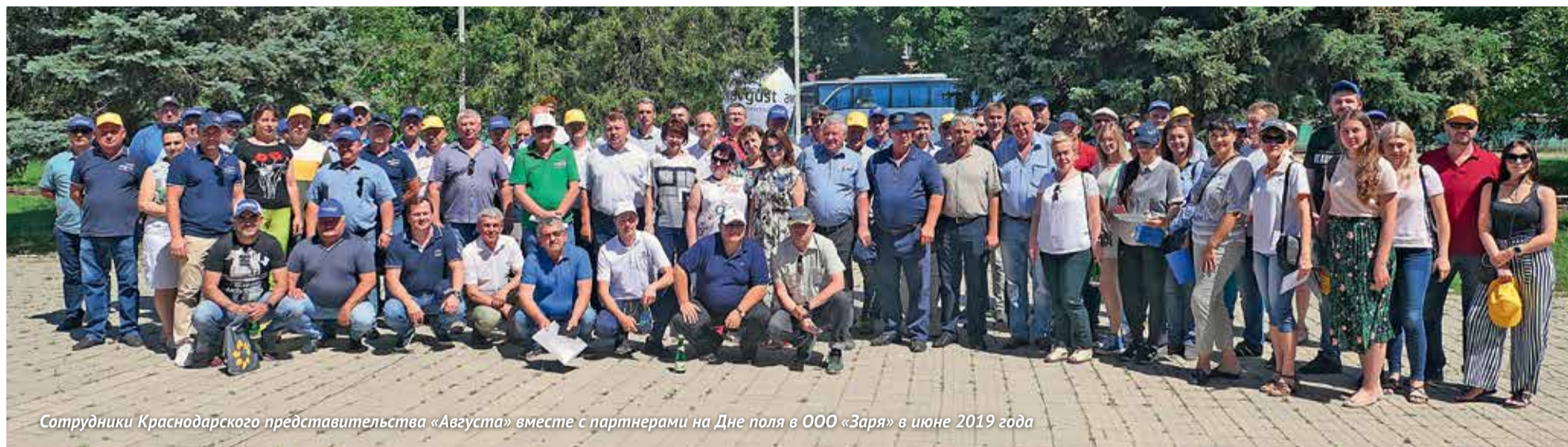
Сотрудники Краснодарского представительства «Августа» вместе с партнерами на Дне поля в ООО «Заря» в июне 2019 года

В ноябре представительство компании «Август» в Краснодаре отмечает 25-летие. Как проходило становление коллектива, что нового привнесли «августовцы» на высококонкурентный пестицидный рынок Кубани, чего удалось добиться? Об этом рассказывает ведущий сотрудник представительства и руководители партнерских компаний «Августа» в регионе.