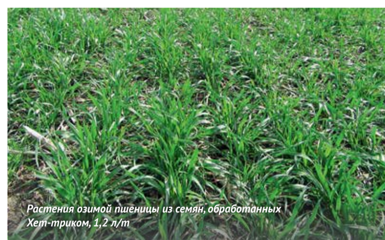
Растения озимой пшеницы из семян, обработанных Хет-триком, 1,2 л/т