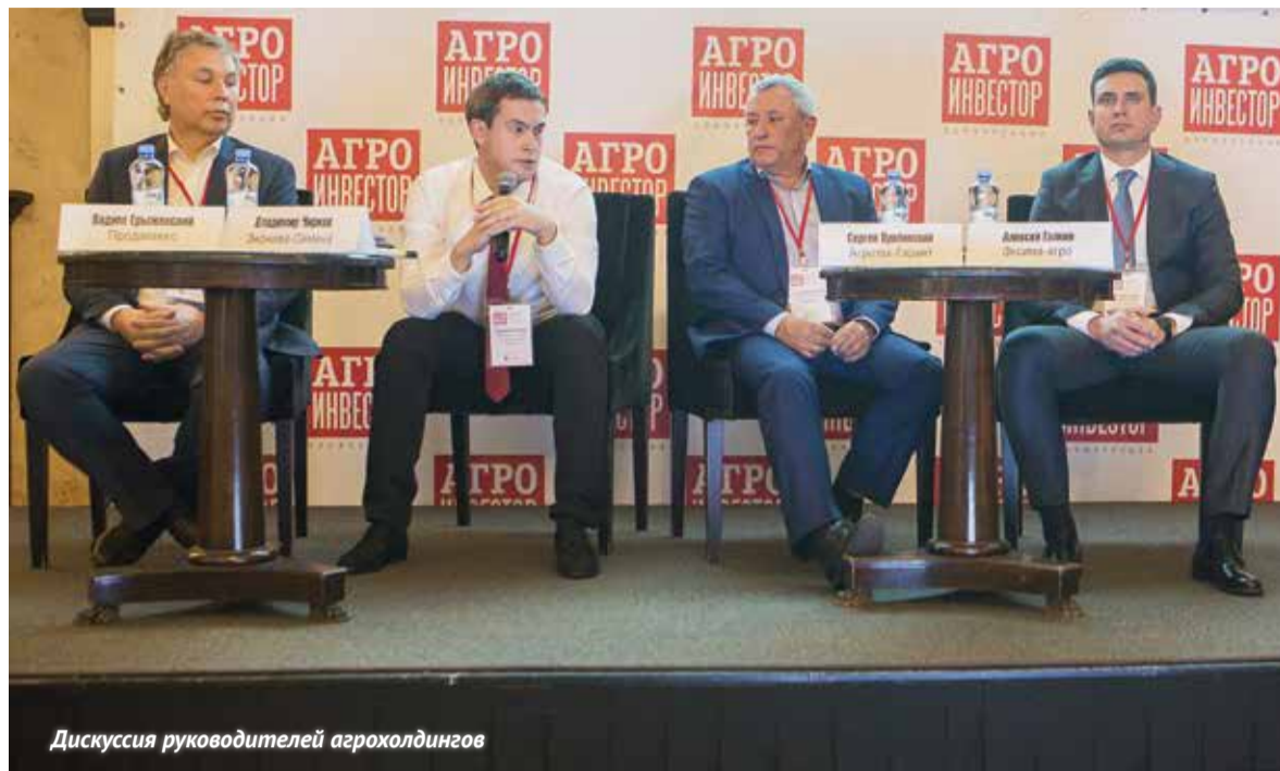
Дискуссия руководителей агрохолдингов

20 сентября в Москве прошла X отраслевая бизнес-конференция «Russian crop production - 2019/20. Растениеводство России: стратегические тренды нового сезона». На ней собрались представители около 250 компаний, суммарно контролирующих до 6 млн га сельхозземель, участники рынков техники и оборудования, семян, СЗР и удобрений.