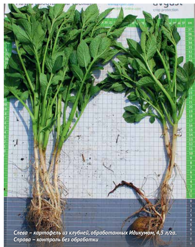
Слева – картофель из клубней, обработанных Идикумом, 4,5 л/га. Справа – контроль без обработки