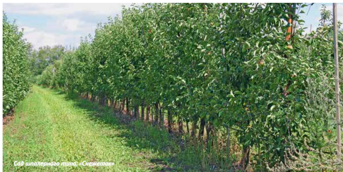
Сад шпалерного типа «Снежеток»

В «Снежетке» защитные мероприятия начинаются в третьей декаде апреля, а затем продолжаются