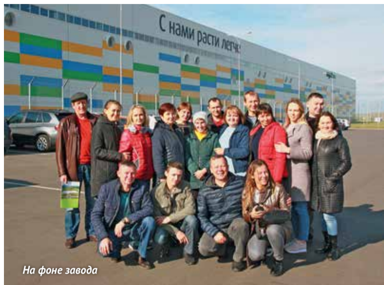
На фоне завода