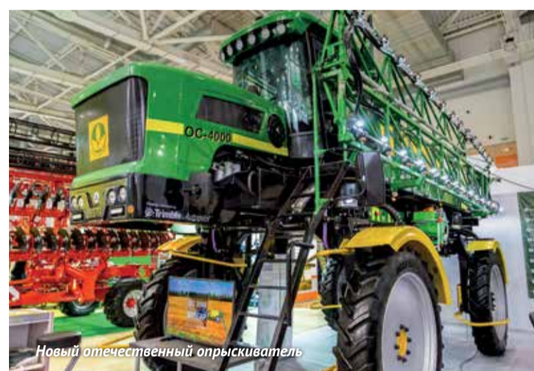
Новый отечественный опрыскиватель