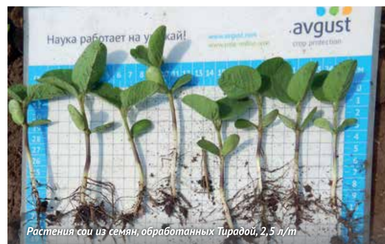
Растения сои из семян, обработанных Тирадой, 2,5 л/т

Из фунгицидов ожидается выход протравителя семян и фунгицида по вегетации Тирада (тирам и дифенокконазол). Этот препарат из группы «Ехреструм» по-настоящему многофункционален и может решить очень широкий спектр проблем на многих культурах.