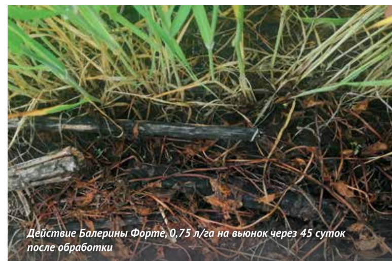
Действие Балерины Форте, 0,75 л/га на вьюнок через 45 суток после обработки

Для защиты посевов сои, льна и зерновых культур от однолетних и некоторых многолетних двудольных сорняков появится гербицид Алсион (тифенсульфурон-метил). В посевах сои в сочетании с Корсаром Алсион увеличивает эффективность смеси против мари белой. Также он хорошо дополняет схему защиты льна масличного там, где недопустимо последствие на следующие культуры.