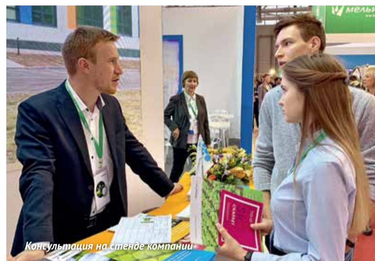
Консультация на стенде компании