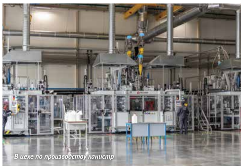
В цехе по производству канистр