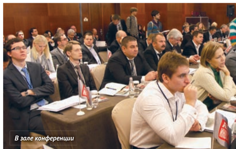
В зале конференции

2 декабря в московском отеле «Арабат Парк Хаятт» журнал «Агроинвестор» провел VIII конференцию «Агрохолдинги России». Число участников стало рекордным за все годы реализации этого проекта – 150 топ-менеджеров агрохолдингов, сельхозпредприятий, инвестиционных, управляющих, лизинговых и страховых компаний, компаний-поставщиков ресурсов для АПК и переработчиков сельскохозяйственной продукции, федеральных аналитиков и отраслевых экспертов. Многие из них – партнеры и клиенты компании «Август».