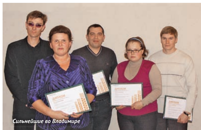
Сильнейшие во Владимире

Многие из них были достаточно сложными для агрономов-практиков, заставляли вспомнить фундаментальные основы сельскохозяйственной науки. Тем не менее, все участники отлично справились со сложным заданием и показали высокий уровень профессионализма – средний процент правильных ответов 57.