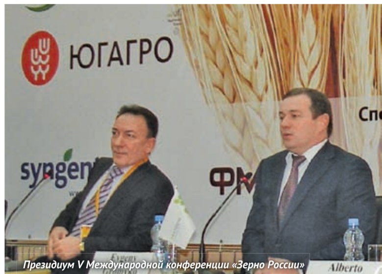
Президиум V Международной конференции «Зерно России»

В работе состоявшейся с 22 по 25 ноября 2011 года в Краснодаре 18-й Международной сельскохозяйственной выставки «ЮгАгро-2011» приняли участие более 600 компаний из 26 стран мира. Их экспозиции располагались в семи павильонах и на открытых площадках «КраснодарЭКСПО» общей площадью более 26 тыс. м 2 .