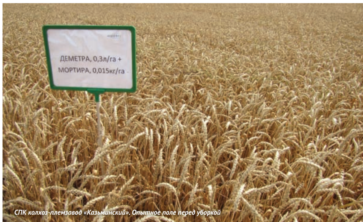
СПК колхоз-племзавод «Казьминский». Опытное поле перед уборкой

Деметра микс – специальное предложение компании «Август» к сезону 2012 года, совместная продажа двух гербицидов для защиты посевов зерновых культур – Деметры (флуороксибир, 350 г/л) и Мортиры (трибенурон-метил, 750 г/кг). В испытаниях, проведенных в 2011 году, смесь показала отличные результаты, ведь одна обработка этой комбинацией способна одновременно уничтожить на поле целый комплекс злостных двудольных сорных растений. Приводим в статье примеры этих опытов.