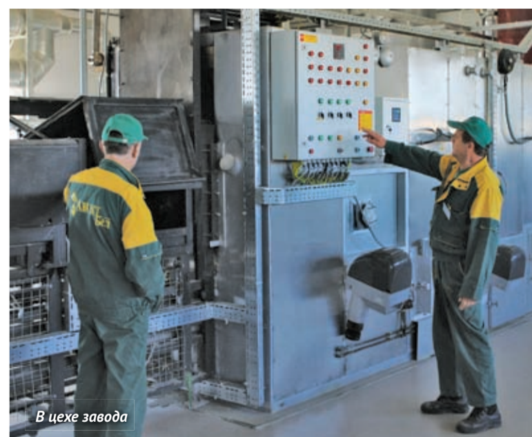
В цехе завода