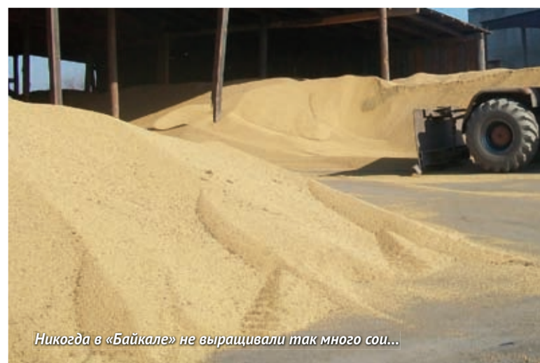
Никогда в «Байкале» не выращивали так много сои...

Многое! Вот удобрения - пока мы вносим их немного, планируем по возможности увеличивать нормы, особенно фосфорных. Но, к сожалению, у нас нет надежных картограмм обеспеченности почвы подвижными элементами питания, из-за этого мы