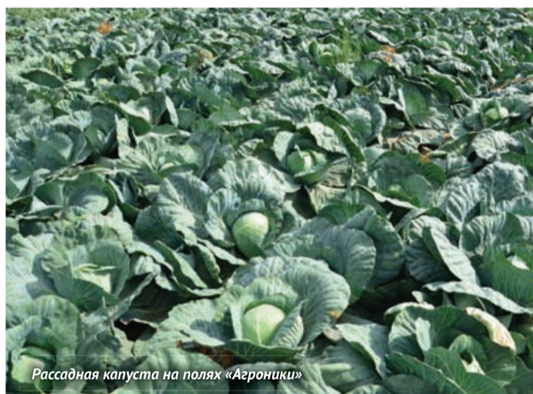
Рассадная капуста на полях «Агроники»

ЗАО «Агродоктор», г. Новосибирск Тел.: (3833) 99-00-82, Моб. тел.: (913) 951-18-09