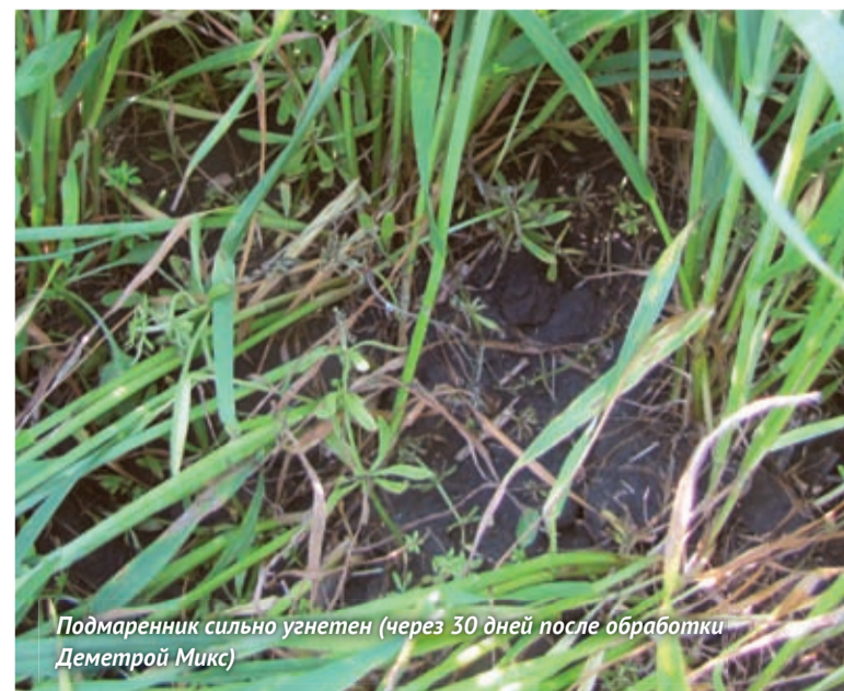
Подмаренник сильно угнетен (через 30 дней после обработки Деметрой Микс)

Приводим результаты испытаний Деметры микс в хозяйствах России в 2011 году и отзывы об эффективности смеси.