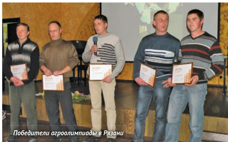
Победители агроолимпиады в Рязани