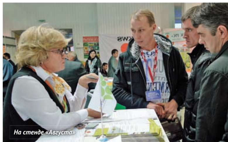
На стенде «Августа»

Традиционно масштабно на выставке был представлен «Август». За четыре дня стенд компании посетили сотни земледельцев из различных регионов Юга России, они ознакомились со всем спектром достижений последнего времени.