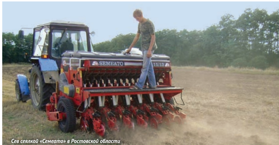
Сев сеялкой «Семато» в Ростовской области

Более трех лет назад в публикациях газеты «Поле Августа» появилась, а затем и стала преобладающей тема No-till, то есть ведения земледелия без какой-либо механической обработки почвы с прямым посевом культур. Практических вопросов по новой системе пока больше, чем ответов. Именно практическая сторона стала главной темой семинара «Перспективы технологии No-till», организованного фирмой «Август» и ОАО «Нижегородагроснаб» 20 декабря 2011 года.