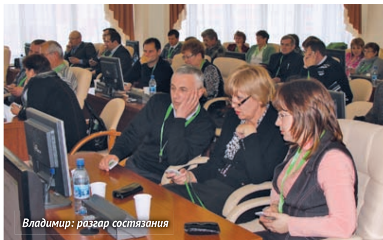
Владимир: разгар состязания

Незадолго до наступления нового, 2012 года, в четырех регионах России, и везде – в первый раз, состоялись агрономические олимпиады «Августа», которые заметно расширили ареал этого движения, вовлекли в его орбиту десятки новых заинтересованных участников. Это агрономы хозяйств, которые прекрасно понимают, что в нынешних условиях знания, профессиональная компетентность технолога полей во многом, если не на все 100 %, определяют отдачу вкладываемых в земледелие средств, величину урожая, доходов хозяйства и, наконец, успешность агробизнеса. Сегодня рассказываем о двух олимпиадах, прошедших в древних российских городах.